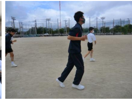
朝ランはしばらく中止に...