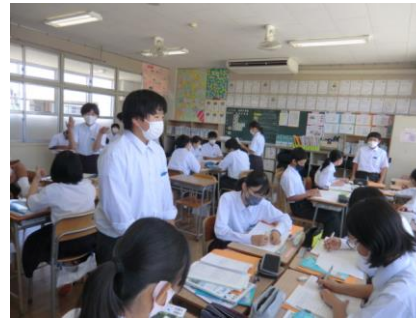
英語の授業の様子