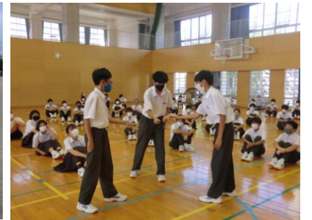
合唱コンクールの曲決めジャンケン